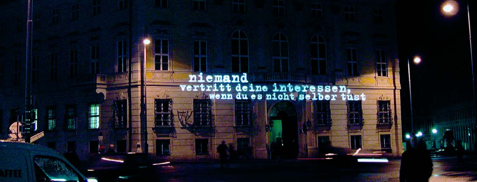
niemand kennt sich aus! | bundeskanzleramt wien | 2003 | Projektion : starsky | Foto : subhash